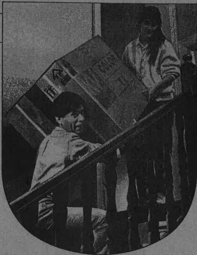
Doyle Dana Bernbach 7

Breng hem zeker een bezoek wanneer u ooit geld wil lenen. Hij zorgt ervoor dat de last van uw lening heel licht om dragen wordt.