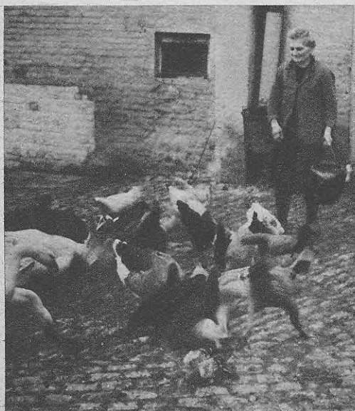
De eenvoudige boerin van 't Groot-Hof voedert het neerhof: hennen, ganzen en duiven fladderen toe... De haan, waar is de haan, die,