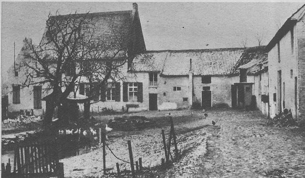
Het Groot-Hof te Amelgem (Brussegem), waarbij de duivelschuur behoort. Deze staat links (onzichtbaar op de foto), gans afgescheiden van de andere hoevegebouwen, wat op zichzelf al een eigenaardigheid is in de Brabantse hoevebouw.