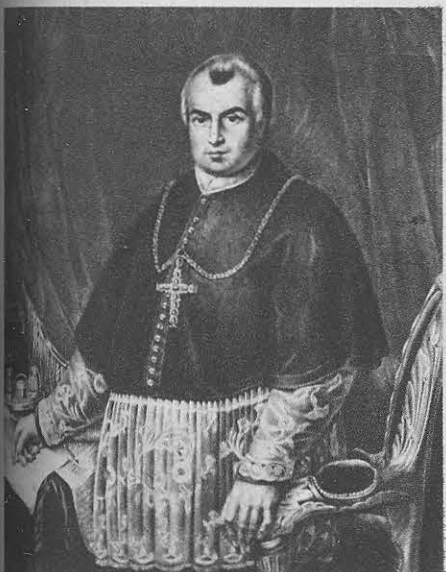
Kardinaal Engelbert Sterckx, aartsbisshoop van Mechelen, die gewonnen en geboren werd op het Klein-Hof te Amelgem. (Naar een

De boer kwam thuis, at zijn pap en deed geen mond open toen gans het gezin onder de