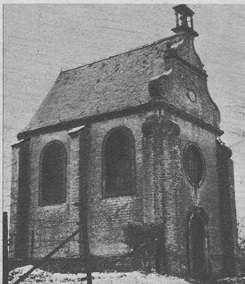
De Amelgemse kapel van O. L. Vrouw-Geboort, in mooie Brabantse barok. De Zondag na 8 September komen de mensen hier beewegen.