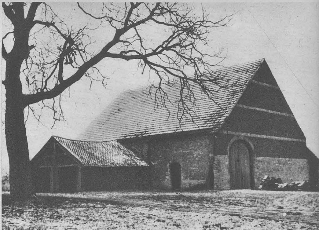
En dit is nu de duivelschuur van Amelgem. Merk de verhouding op: wagenhuis (links) en schuur! Een half dagwand-dak en de schuurpoort als een triomfboog. De onderkant en de drie banden zijn uit echte Brabantse zandsteen.

brede schouw het avondgebed las. En de boerin, een goed mens en zeer godvruchtig: