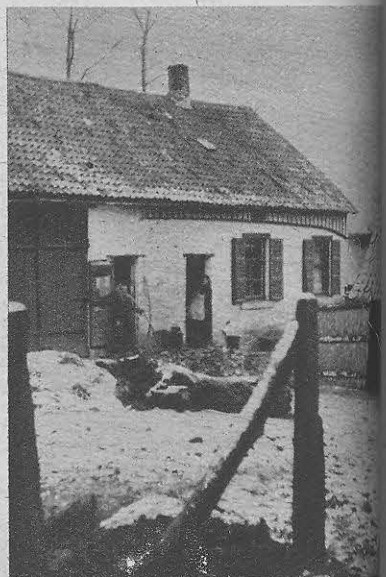
Een typische kleinhoeve op de Kasteelwijk te Amelgem. De mesthoop ligt vóór de fruitladder hangt onder het dak, de veldwerkers zijn er gastvrij en vriendelijk