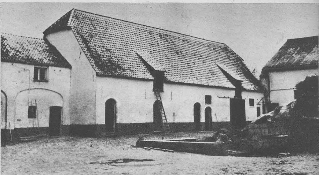
En hier hebt ge een gezicht op de binnenkoer van het Klein-Hof, waar Kardinaal Sterckx werd geboren. Een vaste burcht in de allengheid van het golvende Brabantse landschap.