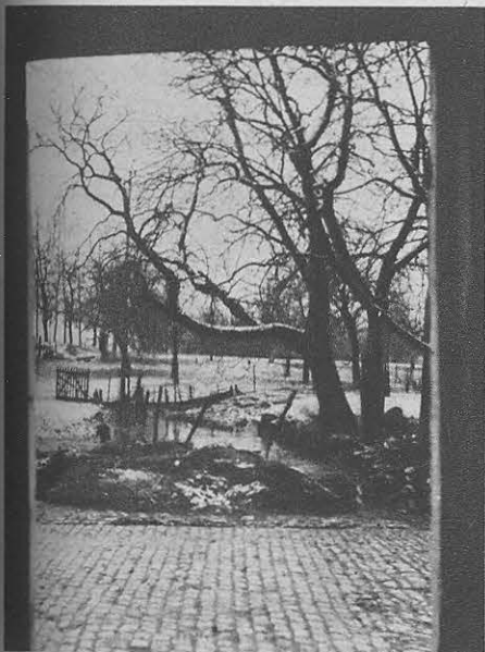
Gezicht op de « messing » van 't Groot-Hof, vanuit de deuropening. Toen de boerin de haan wilde wekken, stoven de duivelen hier met heelder bomen over 't erf.