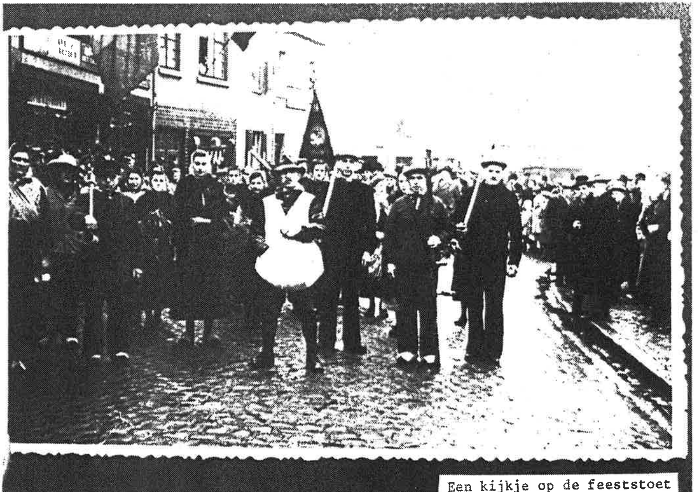
Een kijkje op de feeststoet