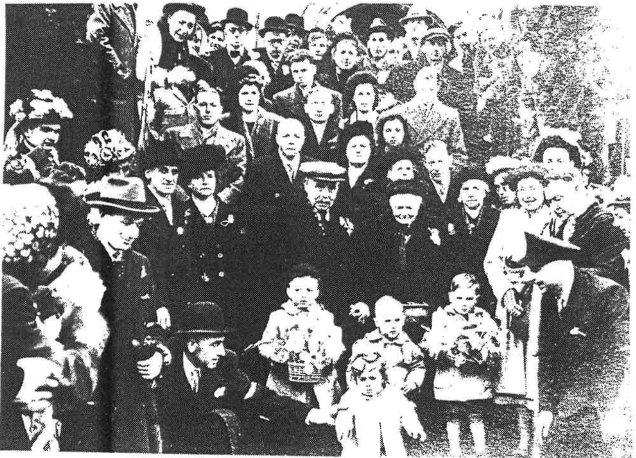
De feestelingen omringd door familie en vrienden