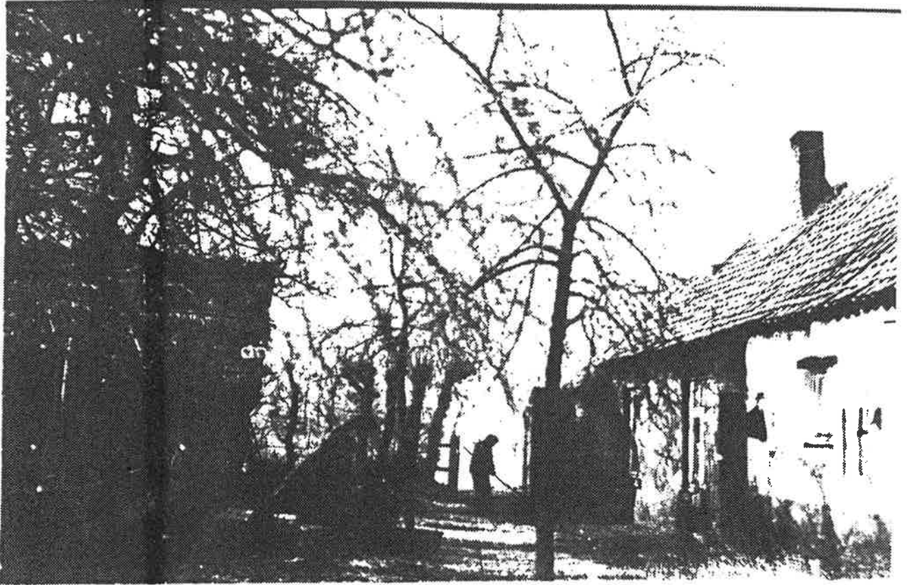
De oude hoeve. Aan de overkant (links foto) een glimp van het bakhuis met het dak geheel in stro en biezen.